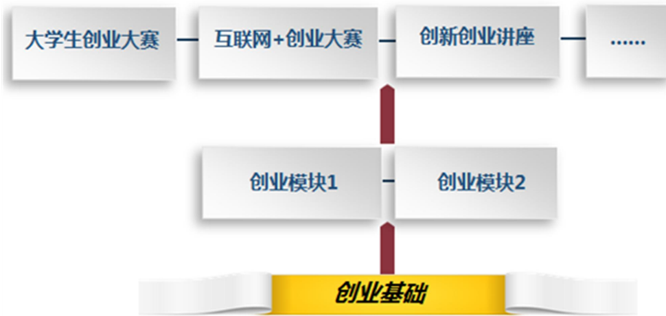
创新创业课程体系建设思路