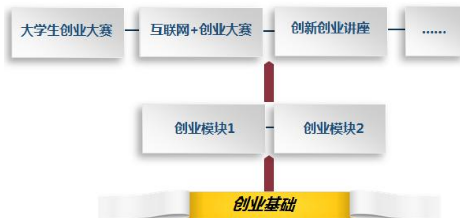
图2 创新创业课程体系建设思路