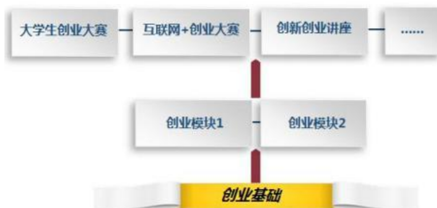
图2 创新创业课程体系建设思路