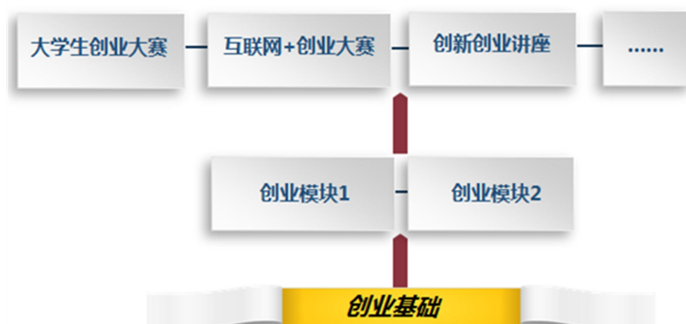
创新创业课程体系建设思路

创新创业教育实践课程模块的培养目标是了解创业的流程、企业的运营模式和项目运作等，掌握创业的基本技能，培养学生分析问题和解决问题的能力，提升学生的个人综合能力。可通过鼓励和组织学生参加企业经营管理类培训、大学生创业大赛、互联网+大赛、大学生创新创业项目等培训或比赛，邀请企业、行业专家开展专题训练，指导学生创新创业活动，促进创新创业的实践教学。其次，可以按照创业活动项目和特定的活动方式，开发创业沙盘、教学游戏和教学案例库，通过现实或模拟的创业实践活动，利用与专业相关的实践平台，利用虚拟的训练或虚拟创业公司，让学生身临其境地感触和体验创业的全部业务流程。创新创业实践课模块安排在第3-5学期，让学生在结合所学的专业基础上来领悟创新创业知识，提高创新创业能力。