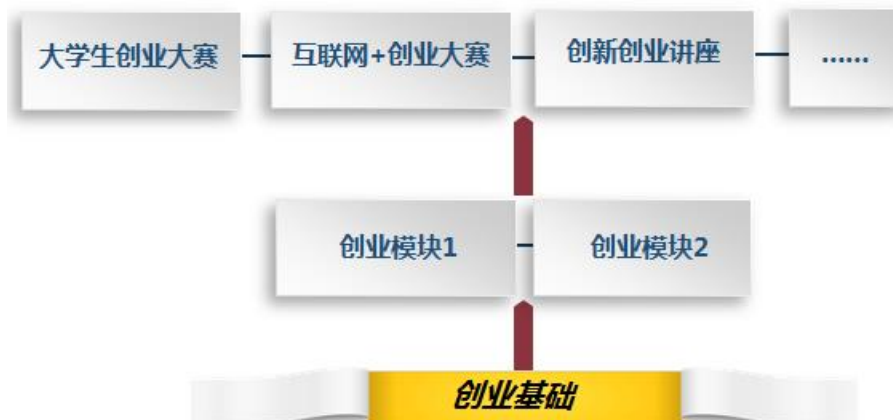
图2 创新创业课程体系建设思路